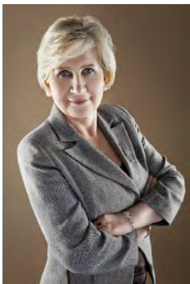
Уважаемые коллеги и друзья!

Мы продолжаем наши интенсивные работы, которые были объявлены в этом году: 31 мая в Эдинбурге, Великобритания, состоялась конференция по теме искусственного интеллекта и Генеральной Ассамблеи AEA-EAL - 1 июня 2019 года. Искусственный интеллект - это уже не будущее, а ежедневная практика растущего числа юристов по всему миру. Вы можете найти презентации с конференции на нашем сайте и фотографии в Facebook. 5-6 июля в Гданьске, Польша, мы организовали очень интересное мероприятие - «Твиннинг юристов», связанное с семинаром по вопросам GDPR и сотрудничества. Твиннинг предоставил прекрасную возможность встретиться с коллегами из различных стран и Азии и Европы в менее формальной обстановке и начать дружественные отношения между юристами из 12 стран, а также обсудить планы дальнейшего сотрудничества на регулярной основе. 6-7 сентября в Тбилиси, Грузия, в сотрудничестве с Ассоциацией Адвокатов Грузии и Юридическим обществом Гонконга будет организована